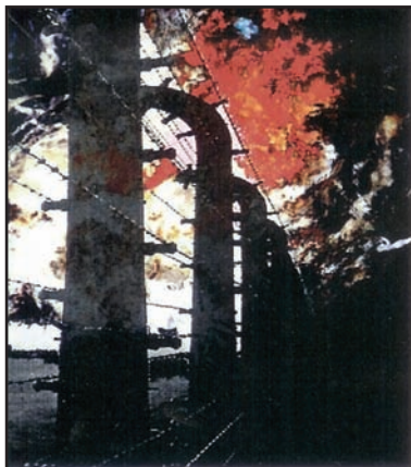
The sky was empty.